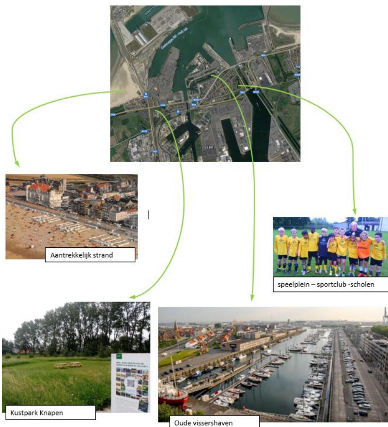
Verspreide troeven in Zeebrugge: nood aan verbinding

De Zeebrugse buurten liggen op een steenworp van een ware energiehub (windenergie, waterstof ...), maar lijken hier nu vooral de lasten van te ondervinden. Door energie te delen met de bewoners kunnen beiden verder ontwikkelen, tot ieders voordeel. De mogelijkheid van een 'lokale energiegemeenschap (LEC)' wordt momenteel onderzocht en via dit project geconcretiseerd. Verder willen we in Zeebrugge aan de slag met een renovatietraject (van advies tot uitvoering) voor de bescheiden woningen. Het renovatietraject komt juist op tijd: gezien de jarenlang aanslepende onduidelijkheid over de onteigeningsperimeter van de nieuwe Zeesluis kampen veel woningen met duidelijk zichtbaar achterstallig onderhoud. Eind 2021 is er echter duidelijkheid over deze perimeter, waardoor er vanaf de start van 2022 renovatiebegeleiding kan aangeboden worden voor de bewoners die blijven wonen in Zeebrugge.