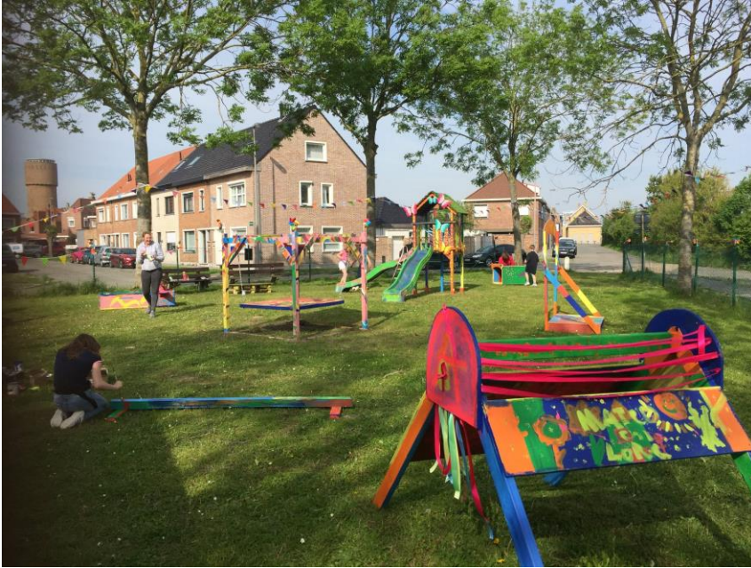
Pretsculptuur buurtgericht netwerk: samen met kinderen bouwen aan een speeltuin in de wijk

De politie speelt een rol in de aanpak van de problematiek van de transmigratie: specifieke acties werden ondernomen (cameratoezicht, fencing, oprichting taskforce ...). Het is echter belangrijk om de buurt te betrekken bij deze duidelijk bovenlokale problematiek. De uitrol van een klankbordgroep is alvast niet gebruikelijk, maar biedt nieuwe mogelijkheden om de problematiek, de aanpak en de gevolgen open te bespreken. De politie is hiertoe bereid.