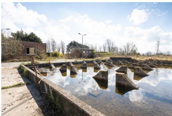
Omvormen van de voormalige militaire basis 'Knapen' tot kustpark.

Het wijkverbeteringscontract zal ervoor zorgen dat de partners mee betrokken worden bij deze projecten en er een gestructureerde, vernieuwende en tussen de partners afgestemde participatie aan gekoppeld is, met een maximaal draagvlak, lokaal én bovenlokaal.