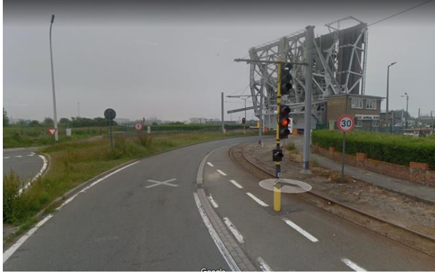
Één van de vele gevaarlijke verkeerssituaties in Zeebrugge.