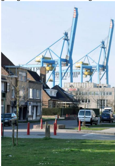
Wonen vlak naast de haven van Zeebrugge

We verweven participatie/communicatie via maatwerk doorheen alle projectonderdelen, en stemmen hierbij ook af tussen het lokale en Vlaamse niveau (cf. Sluisdossier). De samenwerkingen en voorgelegde engagementen getuigen van het brede draagvlak en geloof in het project.